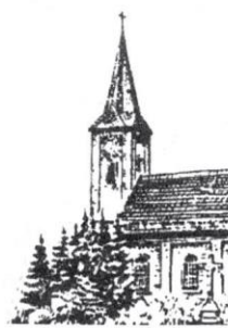
Stavern St. Michael